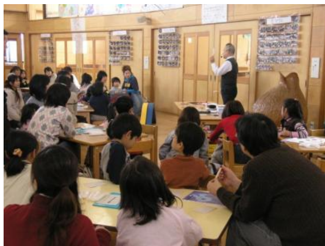
おもしろかんたん発想法