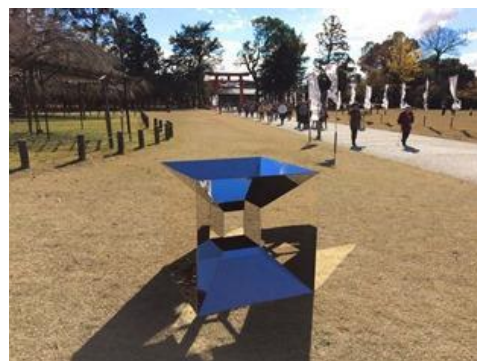
《Void Cube》2015年 高橋綾、田中ゆり、桜井龍、下山肇、(有)榎塚鉄工所