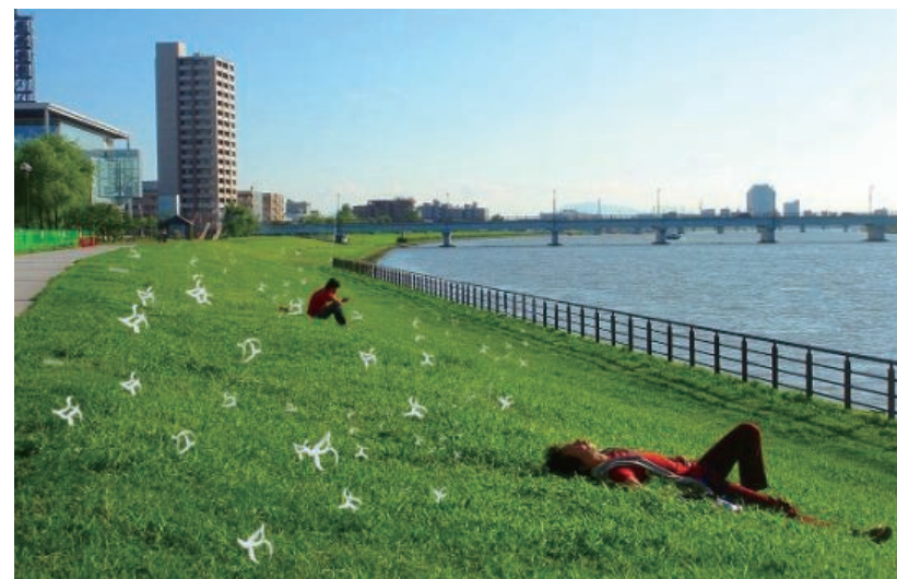
展示イメージ(信濃川・河川敷)