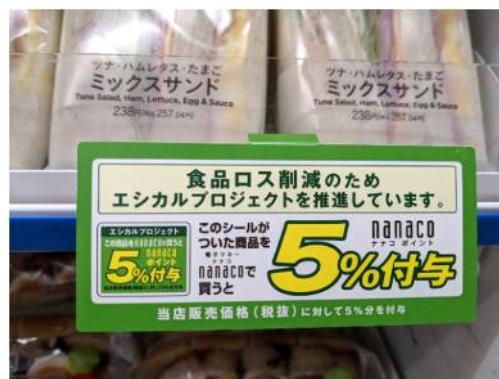
<店頭での販促物の一例>

当社では、高まる環境ニーズに対応するため2019年3月に「ユポグリーンシリーズ」の販売を開始しました。「ユポグリーンシリーズ」はオレフィン系合成紙として日本で初めて植物由来樹脂を配合するほか、独自製法によって、同じ厚みの一般的なプラスチックフィルムと比較し、少ないプラスチック量で必要な性能を確保できることから、石油由来プラスチック使用量の削減に貢献する製品です。